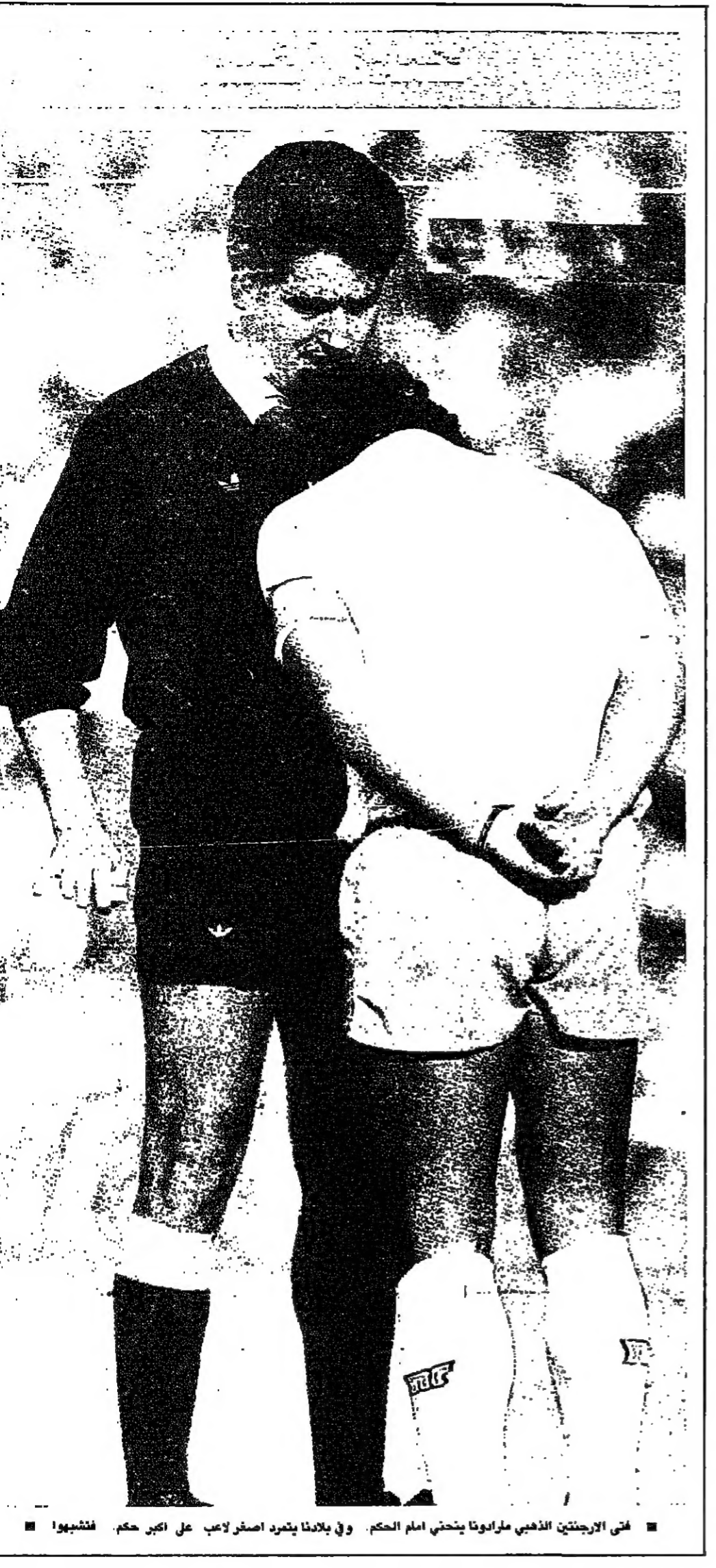
لدى الاجتياز الذي مرارونفا يختمه امه الحكم. وفي بلاندا يثمر اصغر لاعب على اكبر حكم. فثبتهوا

موقف اللاعبين ولجون ماتكنرو موقف صريح في هذا الموضوع فله يرفض التخصيص ويدعو الى منح حرية الاختيار للاعبين بدون قيود.